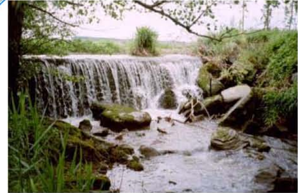
Wehr Sambach Ziel: Durchgängigkeit herstellen, Restwassermenge sichern