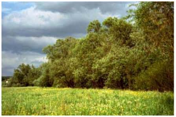
Strukturreicher Gehölzsaum bei Fkm 15