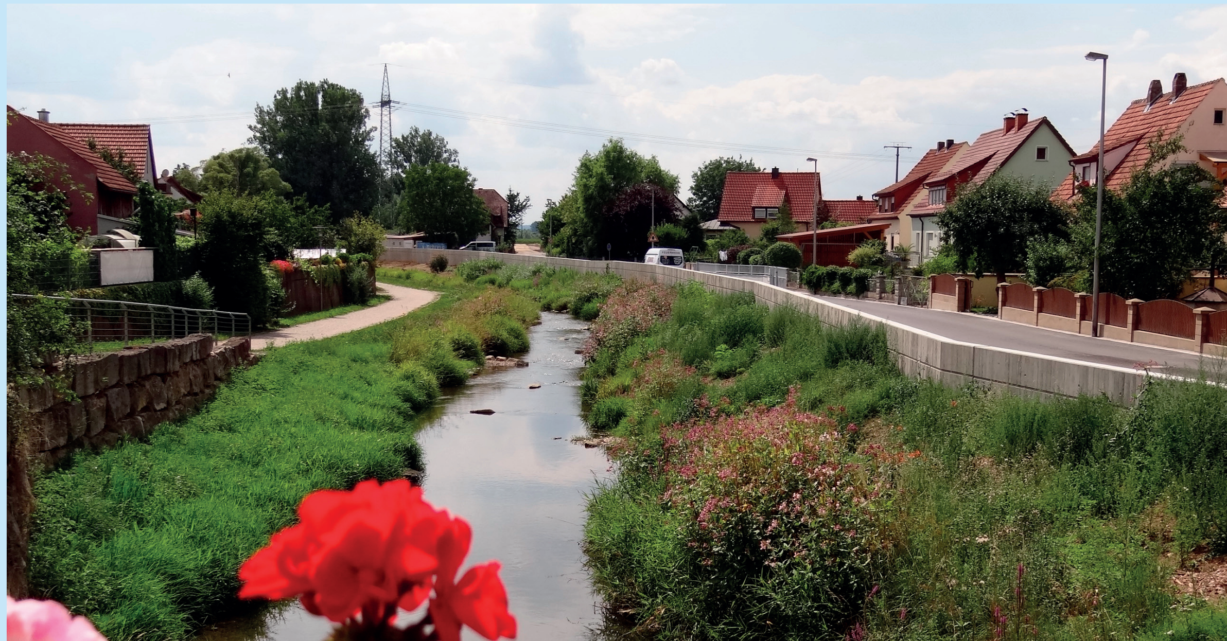
▲ Hochwasserschutzmauern Drosendorf

Nachdem der erste Bauabschnitt der Hochwasserschutzmaßnahme, der noch in der Zuständigkeit des Bezirkes Oberfranken lag, bereits bis 2006 realisiert werden konnte, erfolgte Ende 2014 die Fertigstellung des 2. Bauabschnittes.